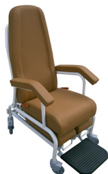
Pie partido Cod. 1250