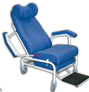
Con cabezal orejero regulable. Cod. 1720 / Ref. SC-U

Tapizado con resistencia a la abrasión, transpiración, saliva, sangre, orina, luz UV, aceites y manchas. Protección antimicrobiana, antibacteriana y antimicótico. Ignífugo M2 y lavable. Impermeabilidad