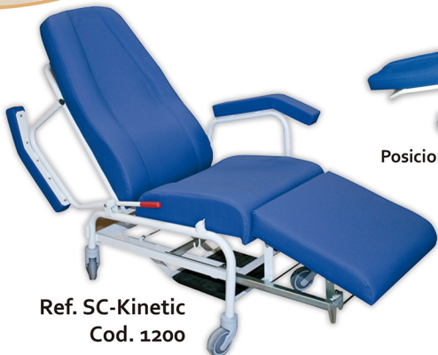
Ref. SC-Kinetic Cod. 1200

Mayor Robustez y Durabilidad. Mayor longitud de Descanso.